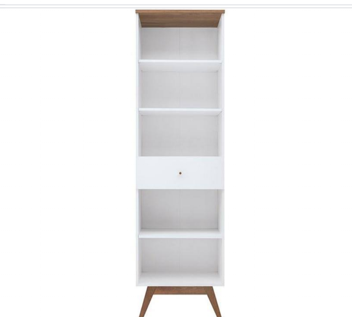
Muebles con diseño Tugow